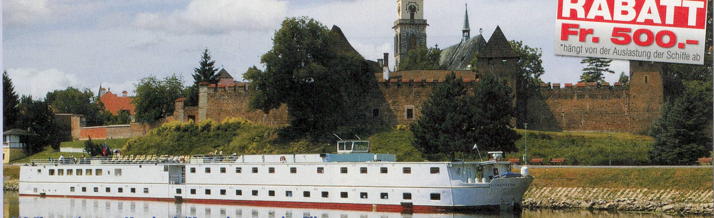
MS Florentina vor Nymburk/Neuenburg an der Elbe

Es het solangs het* RABATT Fr. 500.- *hängt von der Auslastung der Schiffe ab