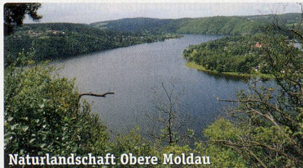
Naturlandschaft Obere Moldau