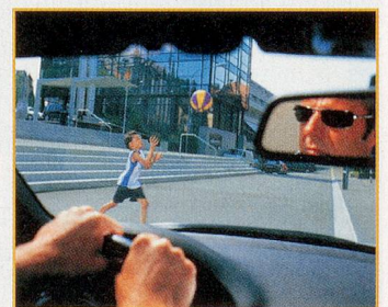
Blendfreie Sicht mit polarisierender Sonnenbrille