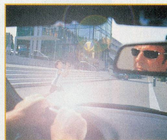
Ohne polarisierende Sonnenbrille