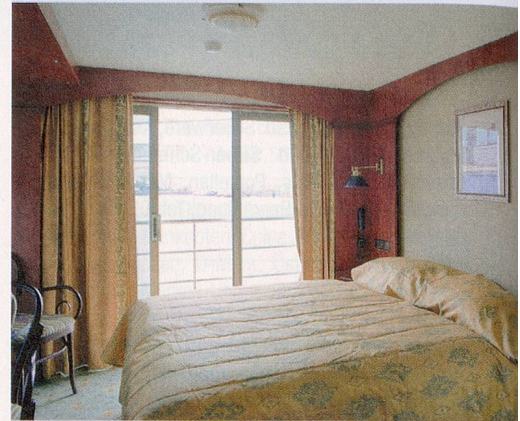
2-Bettkabine mit französischem Balkon Swiss Corona

Rabatt Fr. 900.– bereits abgezogen, HD hinten Swiss Corona