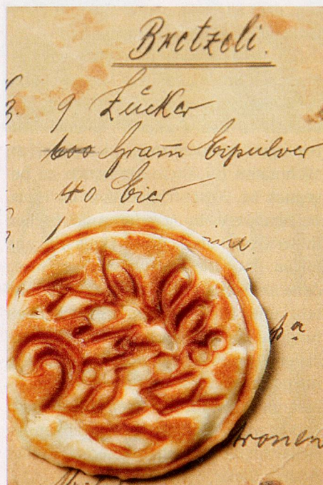
Die Kambly Bretzeli werden nach dem gleichen Rezept und mit derselben Sorgfalt wie vor hundert Jahren gebacken.