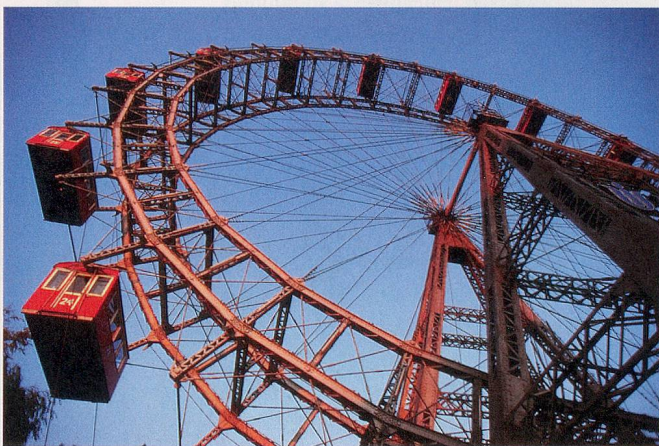
Drei besondere Attraktionen der Zeitlupe-Reise nach Wien: die farbenfrohen Verlockungen der k. u. k. Hofzuckerbäckerei Demel (Bild ganz oben), die Freiluftbühne St. Margarethen im Burgenland (Bild links) und das berühmte Riesenrad im Prater.

zwei Millionen Einwohnern die fünft-grösste Stadt der Welt.