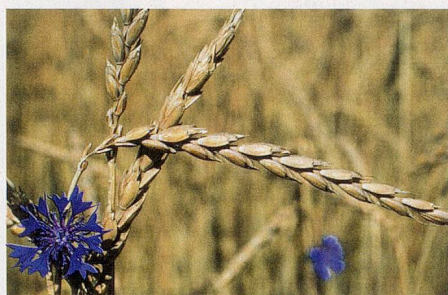
Der UrDinkel aus dem Emmental ...