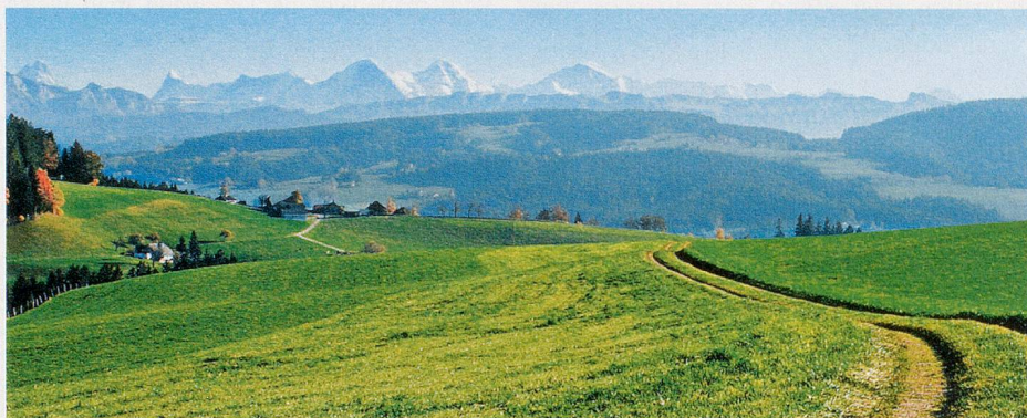
Hier, im Herzen der Schweiz, sind für Kambly die reine Natur und die edlen Rohstoffe, die traditionsreiche Handwerkskunst und die gelebten Werte die Quelle der Inspiration und Kraft, um die Konsumenten weltweit zu begeistern.

Die hohen Qualitätsansprüche an die Kambly Produkte verlangen eine sorgfältige Auswahl der Rohstoffe und eine ausgewogene Komposition der Rezepturen aus natürlichen Zutaten. Kambly bezieht alle Rohstoffe in der Schweiz und – soweit möglich – im Emmental, sofern sie in der nötigen Qualität und Menge verfügbar sind. Für das Bretzeli und die «Emmentaler Hausspezialitäten» wird in der Dorfmühle von Trubschachen Emmentaler Weizen zu Mehl vermahlen. Die altehrwürdige Mühle wird seit 1864 von der Familie Haldemann betrieben, mittlerweile in der vierten und bald in der fünften Generation. Auch der seit Urzeiten im Emmental heimische UrDinkel wird für Kambly in der Dorfmühle sorgfältig verarbeitet.