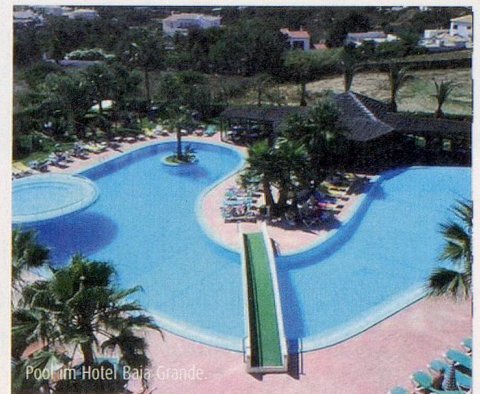
Pool im Hotel Baia Grande