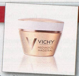
* ca. Marktwert pro Produkt

Die nährende Pflege ist speziell auf die Hautbedürfnisse nach der Menopause abgestimmt und lässt die Haut dank einem einzigartigen Vital-Öl-Komplex, der reich an Omega-3-, 6- und 9-Fettsäuren ist, wieder prall und geschmeidig aussehen.