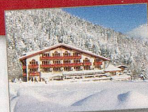
(Einlösbar von Sonntag bis Freitag.)

1 x zwei Nächte für 2 Pers. im Verwöhnhotel Kristall in Pertisau im Wert von CHF 750.-!