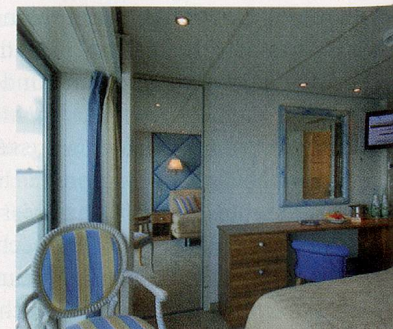
2-Bettkabine Deluxe Oberdeck mit franz. Balkon

Mitteldeck vorn 1590.- / Oberdeck Deluxe 2090.-