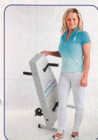
Einfach und leicht zu transportieren

Hält Sie aktiv, fit und beweglich bis ins hohe Alter Schont Gelenke und Knochen – ohne Sturzgefahr Seit 20 Jahren erprobt von Senioren und Reha Kunden