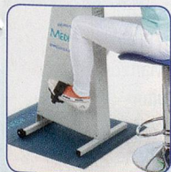
Nur Beine bewegen