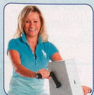
Nur Arme bewegen