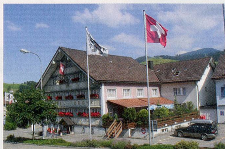
Im Hotel Krone in Urnäsch übernachten die Gäste der Zeitlupe-Reise ins Appenzellerland.

Viel vom immer noch lebendigen Brauchtum und von alten Traditionen zeigt das Appenzeller Brauchtummuseum in Urnäsch. Es befindet sich direkt am Dorfplatz, in einem 400-jährigen Appenzeller Haus. Im Eingangsgeschoss wird man von «wüeschte», «schöne» und «schöwüeschte» Silversterkläusen empfangen, im oberen Stock trifft man auf alte, im Appenzellerland aber immer noch ausgeübte Handwerke. Und auch die typischen Bauernmalereien, Fotos und Modelle zeigen Alpfahrten, wie sie