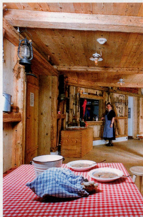
Im Restaurant Schnuggebock werden alte Sitten und Gebräuche gepflegt.