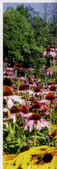
Blütenpracht und heilende Wirkung im Schaugarten des Gesundheitszentrums A. Vogel.

von welchen 60 Prozent ins Ausland geliefert werden. Die Schaukäserei in Stein AR führt Besucherinnen und Besucher in das Geheimnis der Käseherstellung ein – allerdings nicht in das Geheimnis der Kräutersulz, mit welcher die Laibe behandelt werden: Einzig zwei Personen kennen das Rezept, das aus über hundert Kräutern und Gewürzen besteht und seit