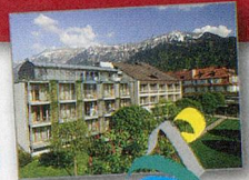
Hotel Artos Interlaken Erholung pur!

1 × 3 Nächte für 2 Personen im Hotel Artos*** Interlaken im Wert von CHF 750.–!