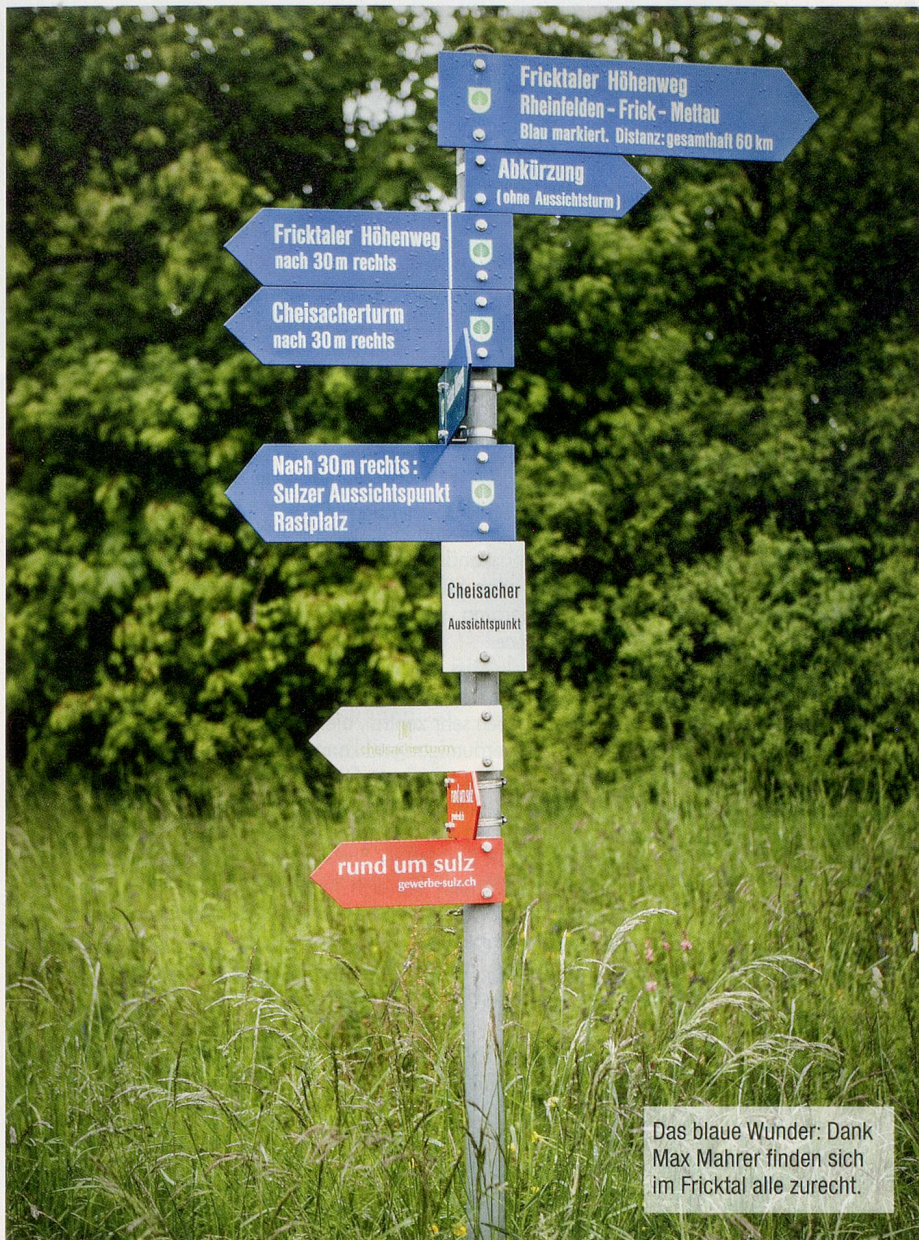
Das blaue Wunder: Dank Max Mahrer finden sich im Fricktal alle zurecht.

Die Idee dazu kam ihm auf einer Gruppenwanderung über den Bözberg: Ob es wohl möglich wäre, das ganze Fricktal zu durchwandern – immer auf den Hügeln über dem Tal? Ein repräsentativer Querschnitt durch die wechselvolle Geschichte und die attraktive Landschaft sollte der Höhenweg werden, möglichst ohne Abstiege ins Tal und ohne lange Streckenabschnitte durch den Wald. Max Mahrer ging auf jeden Hügel, erklimmte alle Aussichtspunkte. Vielfach konnte er den gelben Wanderwegweisern folgen, vielerorts musste er neue Pfade erkunden.