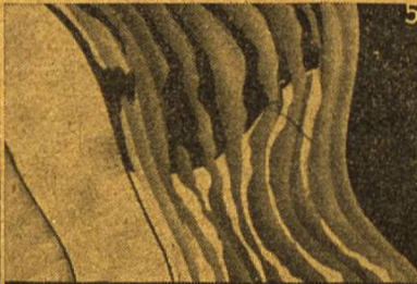
5 Der Zahnstein verliert durch Binaca die Bindekraft