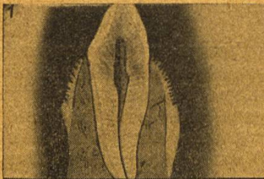
1 Querschnitt durch Schneidezahn, Zahnfleisch und Kiefer