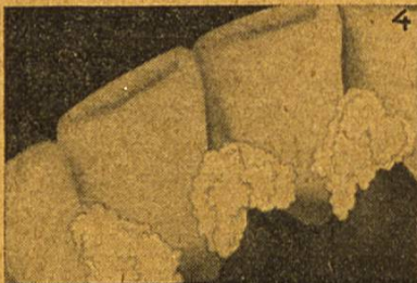
4 Binaca Zahnpaste entfernt die schädlichen Beläge