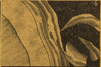
6 Der Zahnstein wird mürbe und durch die Zahnbürste abgetragen

Der offizielle Tonfilm aus der Vatikanstadt