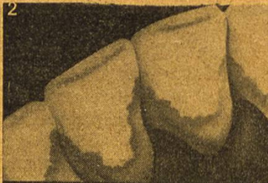
2 Im Munde jedes Menschen bildet sich Zahnbelag