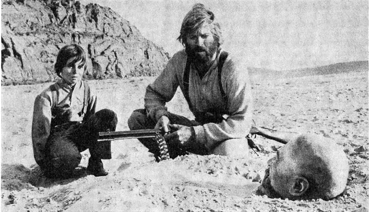
«Jeremiah Johnson» von Sydney Pollack