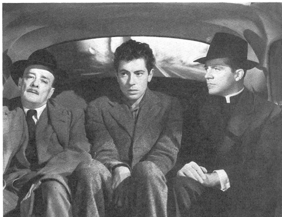
Bild rechts: Martin, der den Priester totgeschlagen hat, mit dem Polizeibeamten, der einen bestimmten Verdacht gegen ihn hegt, und dem jungen Nachfolger des Erschlagenen, der ihm zugetan ist und noch nichts ahnt. Ein symbolisches Bild: der verlassene, junge, schuldige Einzelmensch, eingekerkert zwischen den beiden grossen Kollektive Staat und Kirche. (Verleih RKO.)

Dieser amerikanische Film, über den wir heute eine Kritik veröffentlichten (siehe unten), verdient in mehr als einer Richtung unsere Beachtung. Es geht nicht nur um einen jungen, zerrissenen Mörder und seine Läuterung, sondern auch um die Frage der Entfremdung der Massen von den Kirchen. Es wird behauptet, dass wir daran alle mitschuldig seien, Pfarrer und Gemeindeglieder, dass die Menschen, unsere Nächsten, mitten in den Gemeinden vereinsamen, weil wir uns nicht persönlich um sie kümmern, nichts mehr von ihnen wissen und sie deshalb auch nicht mehr