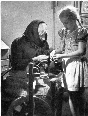
Urgrossmutter und Urenkelin mit der vom Hilfswerk gespendeten Wolle zum Spinnen, oft die einzige Arbeitsmöglichkeit. (Aus dem Film «Es war ein Mensch».)