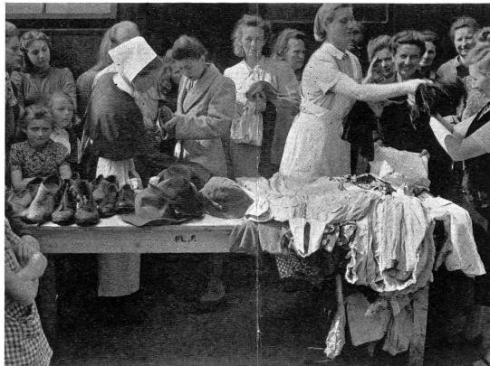
Verteilung von Gaben im Flüchtlingslager. (Aus dem Film «Es war ein Mensch».)