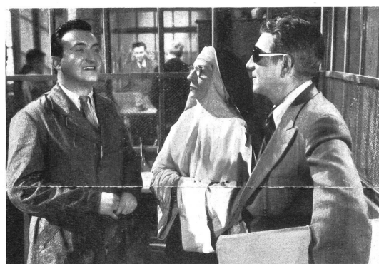
Es gelingt, ihm mit List ins Schulungszentrum für Blinde zu bringen, das ihm zum Sidisalt wird.

matie und List gibt er seine Zustimmung zum Eintritt in ein Schulungszentrum für Blinde, in dessen brüderlicher Atmosphäre er sich bald wohl fühlt. Dort fasst er auch eine Zuneigung zu einer blinden Lehrerin, deren sehender Bräutigam, Wirtschaftsleiter des Zentrums, ihm jedoch aus Eifersucht verrät, dass keine Hoffnung mehr für ihn bestehe, jemals geheilt zu werden. Der harte Schlag treibt ihn zum Selbstmordversuch, um dann jedoch endgültig die Lehrerin mit dem festen Willen an seine Seite zu bringen, ein gemeinsames Glück auch im Dunkel der Nacht aufzubauen. Die Kunst Jean Gabins in der Hauptrolle, von dem es einst hiess, er spiele in keinem Film, in welchem er nicht eine Ermordung darstellen könne, gibt dem Film eine männliche Beherrschtheit, und ver-