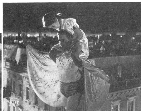
Die Angst des Menschenkinde auf dem hohen Seil (des Lebens): es blickt in die Tiefe und fürchtet sich, starr hinaufzusehen, wo die Verheissung schwebt, sich nicht zu fürchten.

Handlung ist hintergründig, tiefinnig, mit einer Ueberfülle aktueller Beziehungen. Es ist ein modernes Mysterienspiel von Rang, aber auch ein Verkündigungs-film, der uns alle angeht und ausgedehnten Stoff für Diskussionen bietet. — Wir weisen im übrigen auf unsere Kritik im «Dienst» Nr. 4 (April).