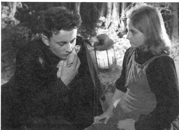
Ein Blutsturz hat den Pfarrer auf dem Weg zu Gliedern der Kirchengemeinde ohnmächtig hinsinken lassen. Eine seiner Schülertinnen aus dem Religionsunterricht wackelt ihn auf und bringt ihm erste Hilfe. Wie Bernanos in seinem Buche, deutet auch Bresson als Regisseur nur an; er malt nicht aus, sondern lässt die Gestalten wieder in die Dunkelheit treten, sobald sie die Situation schemenhaft skizziert haben.

kopfschüttelnd bemitleidet, im kleinen Zimmerchen eines ehemaligen Priesters, der sein Zölibatsgelübde gebrochen hat, stirbt, nachdem er seinem unter Gewissensbissen leidenden ehemaligen Freund die Worte zuzüflerte: «Was macht das denn aus? Alles ist Gnade. Qu'est-ce que cela fait? Tout est grâce.»