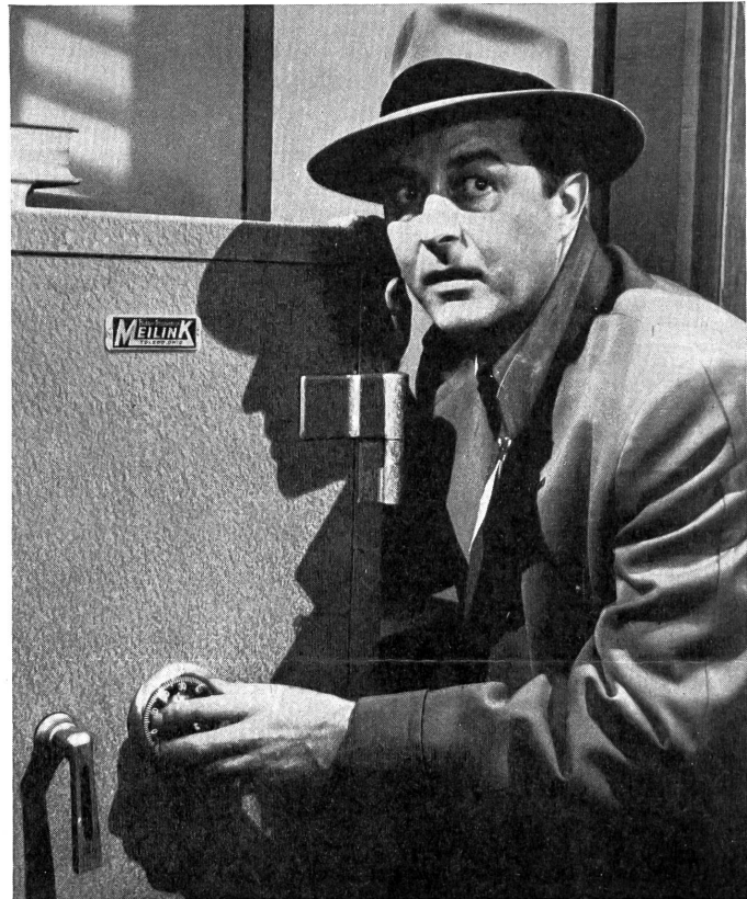
Der Held der Titelrolle (Ray Milland) am Tresor in dem formal außergewöhnlichen Film «The Thief».

Stummfilm? Keineswegs; die Umwelt, in der die Handlung abläuft, ist mit dem Gehör vernehmbar; also lediglich ein Film ohne Sprache. Es ist da der Lärm der Straßen, der Geräuschteppich eines Bahnhofs, das Fegen des Windes um die Terrasse des Wolkenkratzers, das Klingeln der Telephone, das Gezeter eines Grammophons. Diese Vielfalt der Geräusche des Alltags in den Straßen und in den Häusern der Großstadt schafft die hörbare Atmosphäre der Handlung, und das Ungeübte dieser atmosphärischen Gestaltung, die einem zum Bewußtsein kommen läßt, wie unergiebig und ungenau sonst meist der Tonfilm mit den Geräuschen arbeitet, wird zu einem Eindruck der Selbstverständlichkeit dadurch, daß die Geräuschwelt durchaus künstlerisch, das