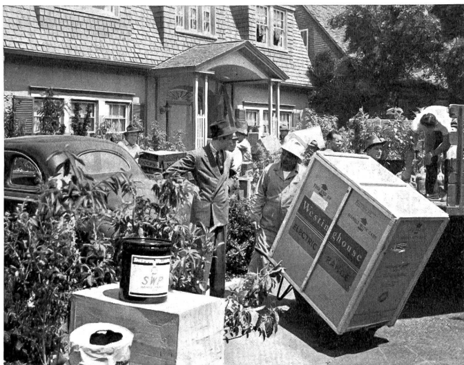
Der unglückliche Radio-Preisgewinner (James Stewart) inmitten eines Stroms von Waren, der sich über ihn ergießt.

ZS. Anspruchsloser, aber heiterer Sommerfilm, welcher vor allem die (bei uns glücklicherweise nicht vorhandene) Mode der Radio-Reklame-Wettbewerbe persifliert. Ein Angestellter eines Warenhauses möchte einmal etwas anderes tun, als immer bloß freundliche Gesichter gegenüber anmaßenden Kunden zu schneiden. Rascher als er denkt, sieht er sich in eine erfreuliche Lage versetzt, denn es gelingt ihm, eines jener unsinnigen Radio-Reklamepreisträgers von 24 000 Dollar zu lösen, allerdings auf nicht ganz einwandfreien Wegen. Was das heißt, erfährt er bald, denn der Preis wird nicht in bar, sondern in Waren ausbezahlt, und wie: ein geschlachteter Ochse, die Jahresproduktion einer Suppenwürfelfabrik, gefrorenes Obst für drei Jahre, ein Flügel, ein Pony, das die Geranien frißt, ein mächtiges Schwimmbad und dazu noch Menschen: ein Innenarchitekt, der die lieben,