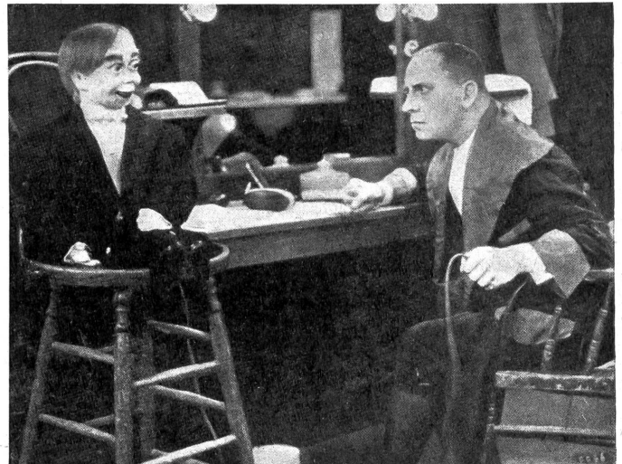
Erich von Stroheim in seinem ersten Tonfilm «The great Gabbo».

Er begab sich auch bald darauf dorthin und fand gelegentlich Arbeit als Extra für Massenszenen. Um diese Zeit begann der berühmte D. W. Griffith seinen Film «Birth of a nation». Stroheim wollte sich bei Griffith einführen lassen, was ihm nicht gelang, bis er auf einen wunderbaren Einfall kam. Jeden Morgen suchte er Griffiths Studios auf und sagte dem Direktionssekretär folgende unabänderliche Formel her: «Erich von Stroheim, Schauspieler, Drehbuchautor, Stunt-Mann, Extra- und Militär-Experte grüßt verbindlichst und wünscht zu wis-