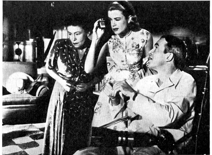
Bild aus dem ersten, in Venedig gezeigten Film »Rear window« (das Hinterfenster), wo ein erkrankter Reporter von seinem Stuhl aus wilde Abenteuer seiner Nachbarn miterlebt.

Es läßt sich manches zugunsten einer solchen Regelung anführen; vor allem würde die auf diese Weise zustande gekommene Preisverteilung vermutlich an Bedeutung und Ernsthaftigkeit gewinnen, was auch kulturellen Kreisen nur erwünscht wäre. Venedig scheint aber, wie wir aus bisherigen Gesprächen erfahren haben, entschlossen, an seinem Erstgeburtsrecht (es ist sechs Jahre älter als das aus Konkur-