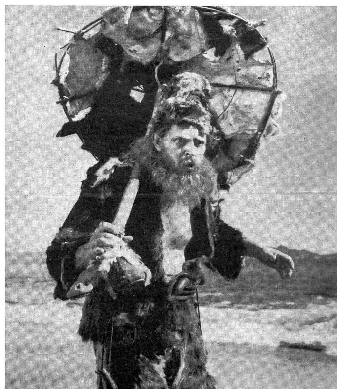
Alle großen und kleinen Kinder können sich freuen: Robinson Crusoe kommt im Film!

Man sieht ein: Klarens Forderung, daß die Tendenz nicht überdeutlich werden dürfe, ist in allen Versuchen, die wir hier nannten, nicht zur Zufriedenheit der SED verwirklicht worden — bald ist die Tendenz zu wenig deutlich, bald ist sie zu deutlich, und wie immer ein Künstler es machen will, er hat unrecht. (Fortsetzung folgt)