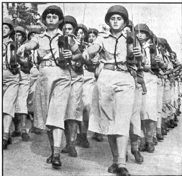
Frauen in der israelischen Armee