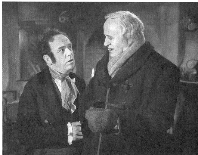
Der alte Geizhals gönnt seinem Angestellten nicht einmal den freien Weihnachtstag.

So etwa reden die Menschen von heute und bringen sich dabei nicht nur um die Bekanntschaft mit einem schönen Werk, sondern versagen einmal mehr vor einem guten Film, entmutigen Kinos, Verleiher und Hersteller. Denn dieser Film ist gut, erhebt und interessant zugleich. Nicht nur, weil er von einem echten Dichter stammt, so daß ihm der Altersstaub nur wenig anzuhaben vermag, sondern weil man immer wieder spürt, daß Dickens jene Not und jenes Elend des beginnenden Industriezeitalters, das den Hintergrund des Filmes bildet, selbst erlebte und erlitt, daß es ihm Herzensangelegenheit war. So erhält die einfache Geschichte von der Wandlung eines verbissenen Wucherers durch Geister, welche ihm sein früheres und zukünftiges Leben vor Augen führen, den Stempel der Echtheit. In einer einzigen Christnacht erleben wir seine Himmels- und Höllenfahrt, die endlich seine Weigerung, sich zu ändern, bricht, nachdem er noch seinen Tod und seinen eigenen Grabstein voraussehen mußte. Wenn der Zerknirschte dann vor Freuden beim Erwachen seine Wirtschafterin umarmt, seinem mißhandelten Angestellten einen besonders großen Truthahn spendet und Kindern zu helfen sucht, so freuen wir uns mit ihm, weil wir durch die dichte Gestaltung und die ausgezeichnete Schilderung der damaligen Zeit und ihrer Menschen überzeugend gepackt worden sind. Die Gegenüberstellung der Londoner Weihnachtsstimmung vor mehr als hundert Jahren mit der menschlichen Bösartigkeit, über die Dickens