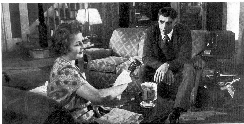
Nach einer neuen Entwöhnungskur finden sie sich leise wieder zusammen, nachdem auch die Frau (eine schauspielerische Spitzenleistung) das Hündchen Sheba endlich für wichtigere Aufgaben vergessen wird.