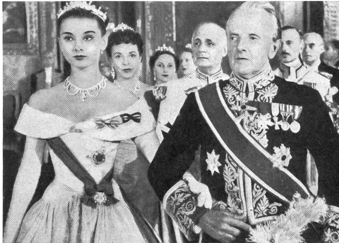
Die Prinzessin, der die Höflichkeiten bei einem Aufenthalt in Rom allmählich zu einer schweren Last werden, auf einem festlichen Empfang (Audrey Hepburn).

Ein hübscher Unterhaltungsfilm, der bereits die Nähe des Sommers ahnen läßt. Mit einem Blick auf den Buckingham-Palast in London und einen andern auf die Sensationspresse erzählt William Wyler die Geschichte der braven, kleinen Prinzessin, die wohl einmal aus ihrem goldenen Käfig ausbricht, um inkognito ein oder zwei vergnügte Tage in allen Ehren mit einem hübschen, jungen Mann zu verbringen, aber dann ebenso verständlich brav, wenn auch gereifter, wieder in besagten Käfig zurückflattert. Und dann gibt es auch noch den jungen Mann, der als Journalist selbstverständlich