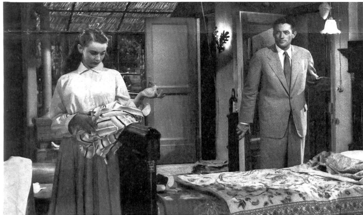
Sie ist durchgebrannt, doch halb bewußlos von einem Reporter aufgefunden worden, der ihr uneigennützig hilft, und mit dem sie einen glücklichen Sommertag verlebt. Als er erfahren hat, wer sie ist, will er allerdings beruflich Gewinn aus dem Zufall ziehen.

trotz des Inkognitos bald herausfindet, mit wem ihn da eine zufällige Fügung zusammenbrachte. Nicht minder brav widersteht er schliesslich der grossen Versuchung, eine ebenso sensationelle wie einträgliche Reportage über seine Erlebnisse abzufassen, worauf beide zwar ein bißchen traurig sind, aber gemeinsam brav von einander Abschied nehmen. Welch schweres Leben doch so eine arme, standesbewußte Prinzessin führen muß! Bleibt nur zu hoffen, daß der doppelt gefestigte Republikaner William Wyler, der Schweizer-Amerikaner, an einer allfälligen Hochzeit von Prinzessin Mar-