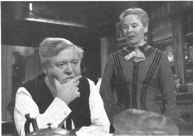
Oben: Die beiden Hauptpersonen des Films: Der Haustyran (Ch. Laughton) wird von seiner ältesten Tochter (Brenda de Banzie) über ihre Heiratspläne in Kenntnis gesetzt. — Unten: Die nicht sehr begeisterte Fühlungnahme mit dem neuen Schwiegersohn.

LAUPEN, 19. JUNI 1954 6. JAHRGANG, NR. 21