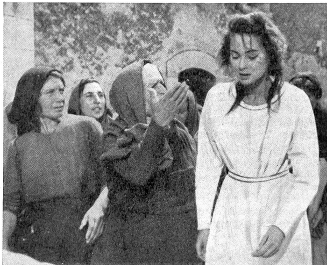
Magdalena wird von dem Pfarrer nicht aufgeklärten und zurückgehaltenen, empörten Frauen verfolgt.

Wie kommt er dazu, seine Gemeinde aus schwächerer Barmherzigkeit durch Verschweigen über die Wahrheit zu täuschen, zu belügen? Er hätte ihr Sünde und Vergebung in einem kundmachen, ihr sagen müssen, daß sie nicht zu richten habe. Statt dessen läßt er alles fatalistisch geschehen, denn die Menschen sind nun einmal Sünder und «können sich nicht ändern». Einen Augenblick lang erhalten wir hier blitzartig eine Erklärung für so viele unglaubliche Zustände in Italien. Keiner wuchert mit dem ihm anvertrauten Pfund. Der Film war zweifellos als katholische Propaganda gedacht, aber der deutsche «Evangelische Filmbeobachter» schreibt mit Recht: «Was dem oberflächlichen