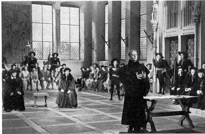
Luther verteidigt die Wahrheit in Worms vor Kaiser und Reich.