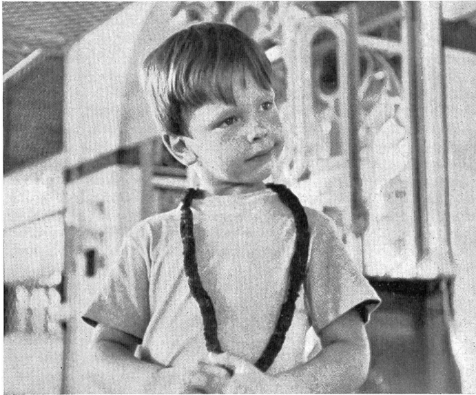
Das ist der Held der Geschichte. Er hat einen kleinen Kranz im Wurfspiel auf dem Rummelplatz gewonnen und verbirgt sein Selbstgefühl nicht.

Das sind die älteren Spielgefährten, welche die berühmtesten «Comic books» verschlingen und durch ihre dummen Streiche dem Kleinen einen tödlichen Schrecken einjagen.