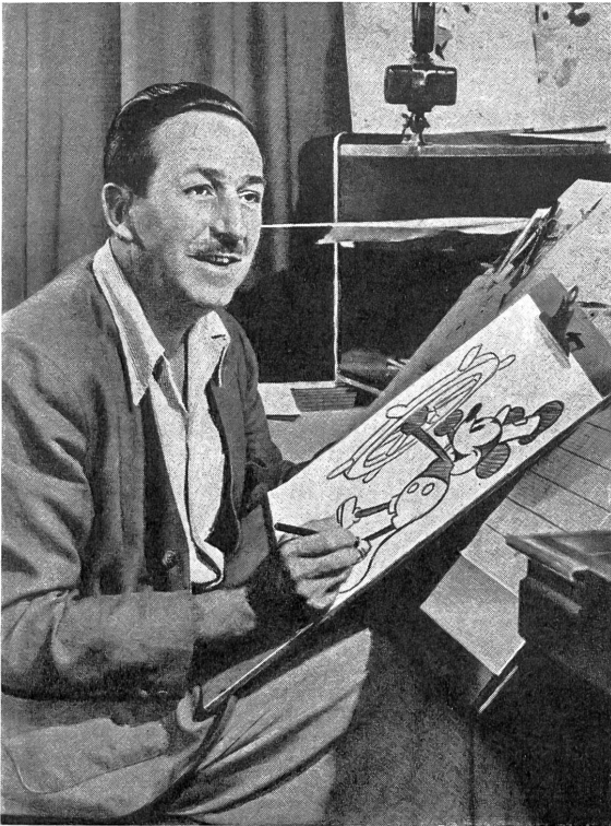
Walt Disney mit einer Zeichnung der Mickey-Maus.

lich, weil ihm die Ausführung seiner Ideen wichtiger war, als das Essen. Aber ständig spürte er die Nähe eines neuen Bankerottes, während vielen Jahren. Er wußte, daß er Neuland bearbeitete, und daß er deshalb nur durch methodische Experimente am lebenden Objekt, das heißt am Publikum, zu einem Erfolg käme. Das war ihm viel wichtiger als großer Gewinn. Er hatte einen lustigen Raben erfunden, der in den Kinos Anklang gefunden hatte, Oswald. Aber sein Geldgeber verlangte neue Filme der gleichen Art und verbot ihm das Experimentieren. Verhandlungen in New York halfen nichts. So setzte er sich mit seiner Frau wieder in den Zug nach Hollywood. Verzweifelt suchte er auf der Fahrt wieder ein neues Tier auf den Zeichenblock zu zaubern, das Anklang fände. Nach vielen vergeblichen Versuchen brach seine Frau in Begeisterung aus, als er Mäuse zeichnete: Das war es! Das hatte sozusagen Seele! Mickey-Maus war geboren, in einem Eisenbahnzug, und wurde sein erster Welterfolg. In einer Art schöpferischem Delirium zeichnete er ihre Geschichte und trieb seine Mitarbeiter zur Ausführung auf Film. Die Bankerrott-Gefahr schien gebannt, die Dollars-Millionen begannen zu fließen.