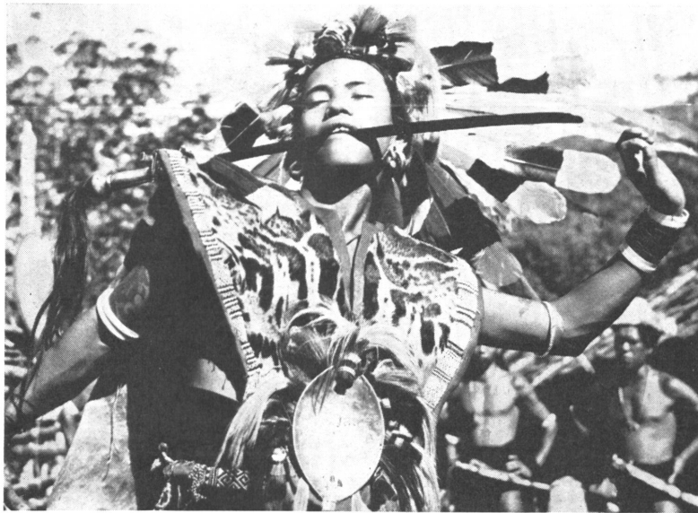
Neunjährige Tänzerinnen tanzen am Urwaldrand das Märchen der Prinzessin Rama beim Reiserntefest.