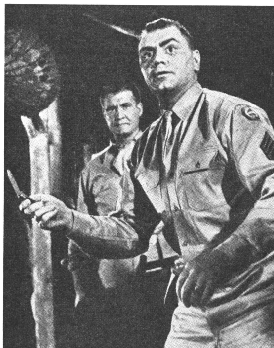
Der gutmütige, aber im Film immer brutale Rollen spielende Borgnine (mit Ausnahme von «Marty»), hier als böser Sergeant Fatso aus dem Film «Bis in alle Ewigkeit». Trotz des Erfolges in «Marty» scheint er von dem Rollenfach des Bösewichts nicht loszukommen.

Schade, denn er könnte anders. Das hat er bewiesen, als er im «Marty» die Hauptrolle als einsam-sehnsüchtiger Junggeselle zu spielen hatte. Der Film machte ihn weltbekannt, vermochte ihn aber nicht aus der gewohnten Tätigkeit herauszuführen. In «Bad Day at Black Rock» spielt er den Dorf-Schläger, der von Spencer Tracy außer Gefecht gesetzt wird. Er sperrte sich gegen diese Rollen, aber es hilft ihm nichts. Sein Agent hat ihm bewiesen, daß er zuerst ein Vermögen er-