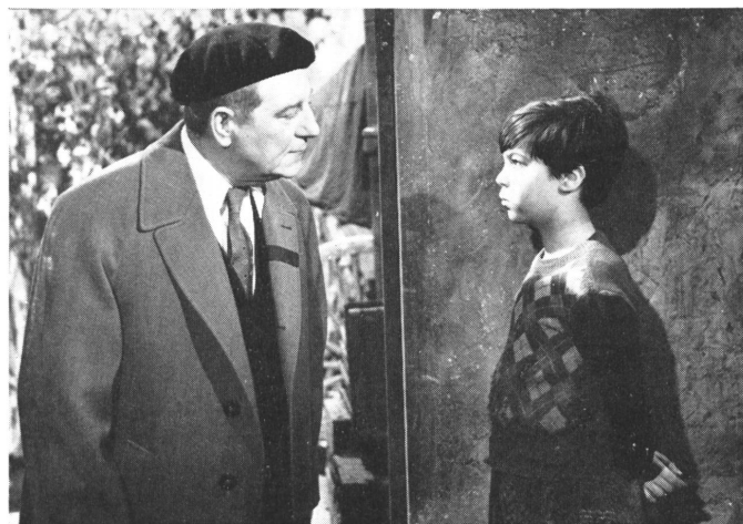
Der gütige Jugendrichter (Jean Gabin) mit einem der kleinen Sünder.

und die ihn auf ihre zerfahrene Art, mit der sie mit Männern umzugehen pflegt, ebenfalls liebt. Hier kann noch Vertrauen wachsen, entscheidet der Richter, und Gérard wird glücklich werden.