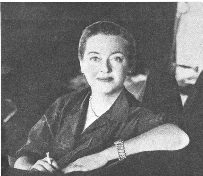
Bette Davis ist nach langer Krankheit wieder zum Film zurückgekehrt und hat sich erneut als große Künstlerin erwiesen, die mit großen Rollen überhäuft wird. Nach einem guten Anfang in der «Jungfräulichen Königin» dreht sie gegenwärtig «Storm Center», die Geschichte einer Bibliothekarin, die ein gefährliches Buch nicht herausgibt und einen Sturm entfesselt.

Fellini wollte festgestellt haben, daß er früher Witzblatt-Zeichner und Bühnenmaler, sowie mit Rossellini zusammen Drehbuchautor war, niemals Schauspieler, mit Ausnahme einer kurzen Rolle als Pseudo-Heiliger in Rossellinis «Das Wunder». Er verteidigte bei dieser Gelegenheit Rossellini mit Nachdruck, der keineswegs erledigt sei. Daß es heute so scheine, sei Rossellinis Neigung zum Experiment zuzuschreiben, er sei ein edler Spürhund, der überall nach neuen Ideen