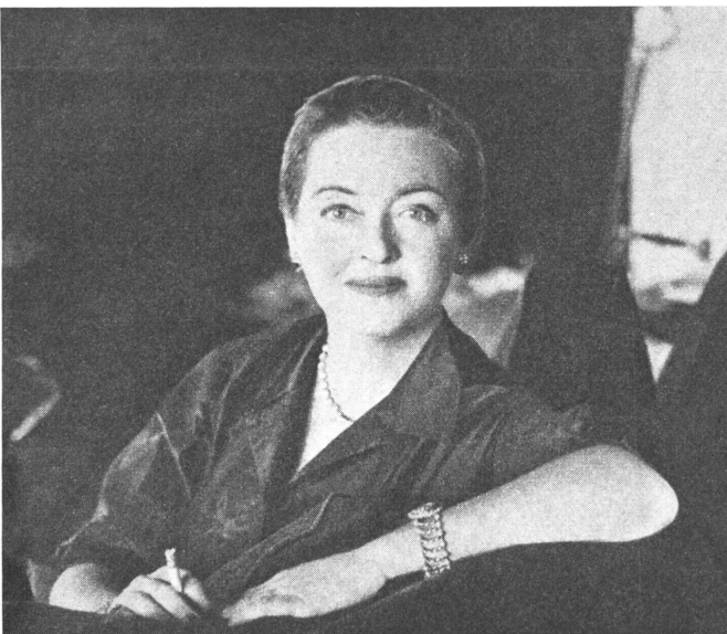
Bette Davis ist nach langer Krankheit wieder zum Film zurückgekehrt und hat sich erneut als große Künstlerin erwiesen, die mit großen Rollen überhäuft wird. Nach einem guten Anfang in der «Jungfräulichen Königin» dreht sie gegenwärtig «Storm Center», die Geschichte einer Bibliothekarin, die ein gefährliches Buch nicht herausgibt und einen Sturm entfesselt.

Fellini wollte festgestellt haben, daß er früher Witzblatt-Zeichner und Bühnenmaler, sowie mit Rossellini zusammen Drehbuchautor war, niemals Schauspieler, mit Ausnahme einer kurzen Rolle als Pseudo-Heiliger in Rossellinis «Das Wunder». Er verteidigte bei dieser Gelegenheit Rossellini mit Nachdruck, der keineswegs erledigt sei. Daß es heute so scheine, sei Rossellinis Neigung zum Experiment zuzuschreiben, er sei ein edler Spürhund, der überall nach neuen Ideen