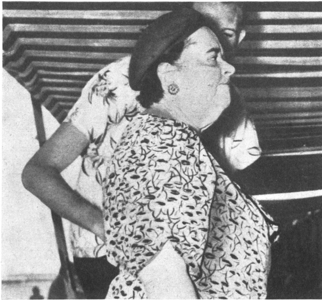
Elsa Maxwell, die mit ihren Berichten über die Filmstars eine oft unheilvolle Macht ausübt, in Venedig.