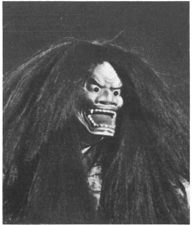
Der böse Theatergeist (künstlerische Theatermaske aus Japan).