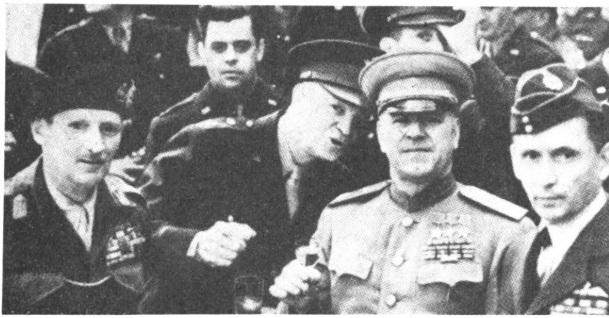
Einst in Berlin (1945): Die Marschälle Eisenhower und Schukow, Amerika und Rußland, friedlich vereint.