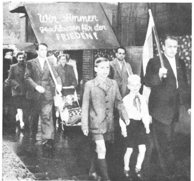
Heute in Ost-Berlin: Friedensdemonstration der Bevölkerung, aber ohne Eisenhower und Schukow.