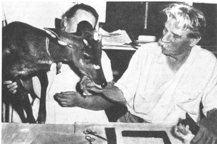
Neueste Aufnahme von Albert Schweitzer an der Arbeit in Lambarene.