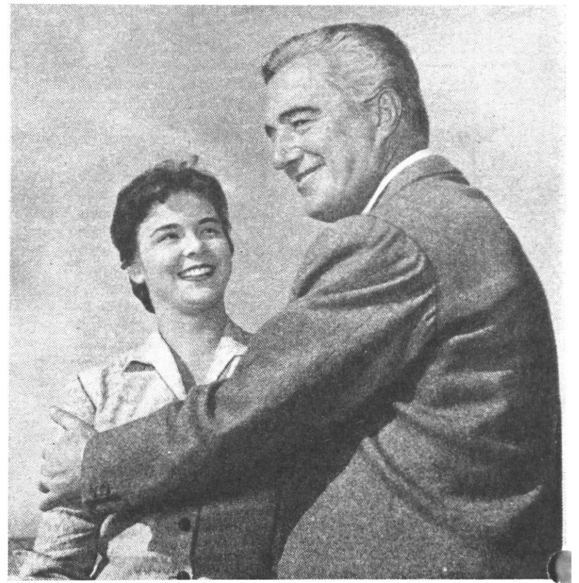
De Sica mit der endlich gefundenen Darstellerin seines neuen Films «Das Dach», einem Mädchen aus dem Volk, was zu Gegenmaßnahmen der Berufsschauspieler führte.