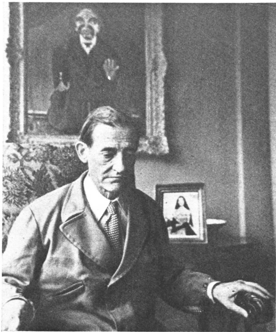
Maurice Utrillo, einer der führenden Maler der modernen Zeit, ist 72jährig in Paris gestorben. Von genialen Fähigkeiten, führte er ein stürmisches Leben und endete im Mystizismus.