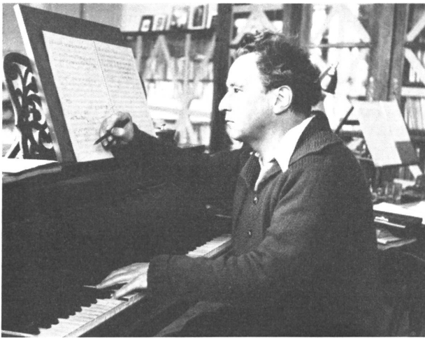
Arthur Honegger, der in Paris verstorbene Schweizer Komponist, bei der Arbeit, die ihm große Ehrungen einbrachte. Er schrieb auch protestantische Kirchenmusik.