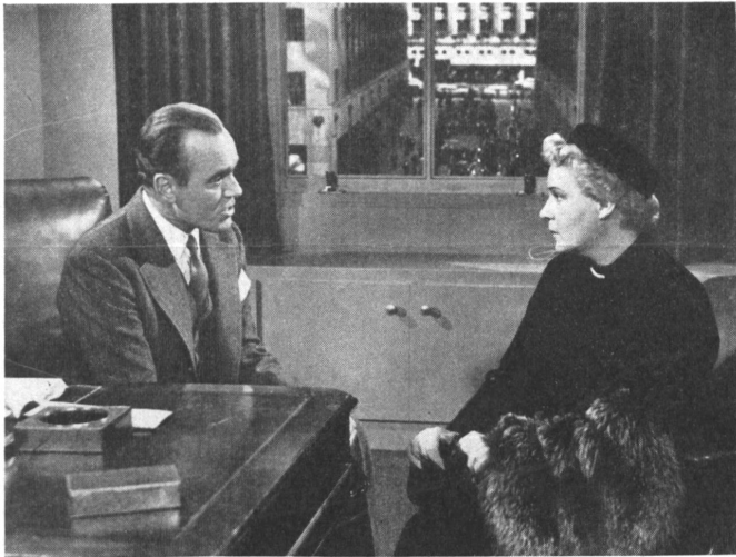
Shirley Booth, die hervorragende Schauspielerin, im Gespräch mit einem Anwalt im Film «Romanze ohne Morgen».

Der Film hat eine Melodie, die Melodie des schönen, reifen Gefühls. Sie wird nicht ausgespielt, sie wird nicht eingebettet ins Melodramatische. Von der Geschichte der Liebe, die hier erzählt wird und der man den unglücklichen deutschen Titel «Romanze ohne Morgen» gegeben hat, wird nur angerührt, wem das Halbgesagte, das im Nebenbei Ausgedrückte etwas zu sagen vermag. Eine Frau, Dancingsängerin, lernt einen Mann kennen. Sie findet, schon an die Schwelle des Alters ge-