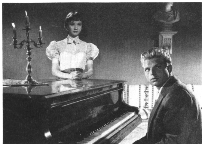
Bild oben: Der Staatspräsident, der sich fälschlich von einem jungen Mann vor einem Attentat gerettet glaubt, mit seiner Tochter (Liselotte Pulver).

Der junge Mann ist in Wirklichkeit ein Revolutionär, der den ihm angebotenen Aufenthalt im Hause des Präsidenten zu dessen Ermordung benützen will. Nur die Liebe zu dessen Tochter hält ihn zurück.