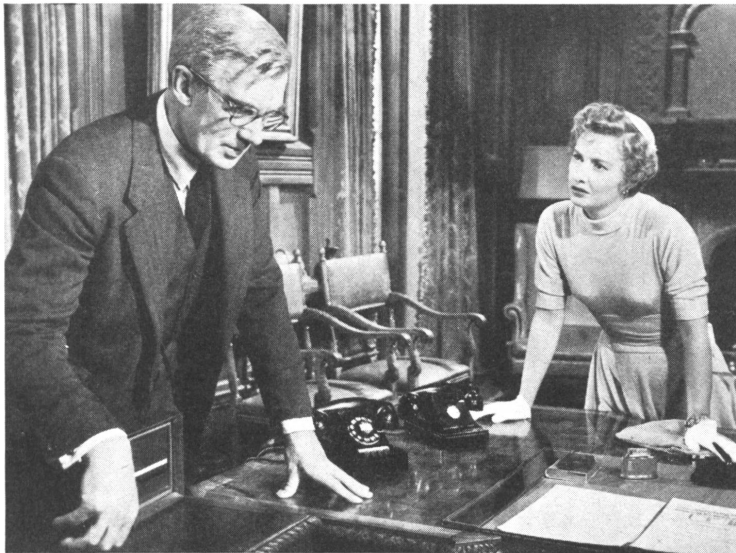
Die Nachricht vom Tode des Verwaltungsratspräsidenten trifft bei der Großfirma ein. Für die Tochter des Gründers und einen der Vizepräsidenten ist sie ein harter Schlag.

AH. Nüchternes Geschäftsleben — was kann das schon für einen Filmstoff abgeben? Wo bleibt da die «Traumfabrik»? Die Amerikaner haben es gewagt, ein Thema aus diesem Gebiet zu verfilmen, und zwar ein wesentliches. Es geht beim Tode eines Verwaltungsratspräsidenten um eine spannungsgeladene Auseinandersetzung in einer Großfirma über das zukünftige Vorgehen: Gewinn, Profit, hohe Dividenden, Sicherheit, Bequemlichkeit, Ruhe für heute — oder Unruhe, Wagnis, Experiment, Eroberung von Neuland, Plänen für morgen, Wachstum, Leben? Gewiß kein poetisches Anliegen, künstlerisch unergiebig, trotz glanzvoller Besetzung der Rollen nicht sehr gestaltungsfähig, aber überaus wichtig und aktuell für alle, die Verantwortungen zu tragen und Entscheidungen für Organisationen zu treffen haben. Der Film ist ein Vorstoß in Neuland, den die Nur-Aestheten wahrscheinlich nicht sehr schätzen werden, aber ein mutiger, wenn auch nicht völlig geglückter Anfang, von dem nur zu bedauern ist, daß es wieder die Amerikaner sind, welche ihn uns vormachen.