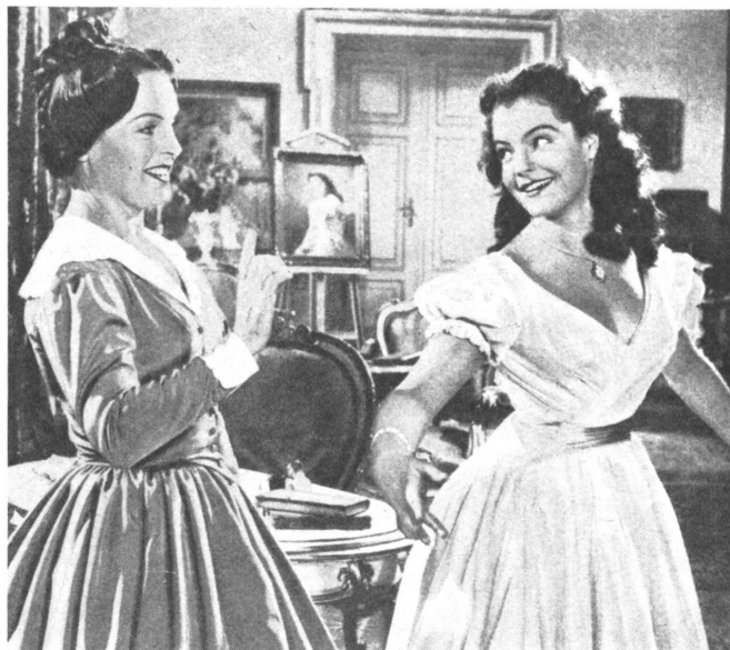
London auf wienersisch: Die zukünftige Königin Victoria mit ihrer Erzieherin im Film «Mädchenjahre einer Königin».

ms. Die Wiener haben kindliche Freude an Majestäten und jungen Prinzessinnen. Da sie das Arsenal der eigenen dahingegangenen Monarchie ausgeschöpft haben, halten sie nach anderen Königreichen, in denen es vielleicht ebenso gemächlich zugegangen ist, Ausschau. Und sie finden ein solches Königreich: England. O, nicht das England der heute regierenden und die Blätter der illustrierten Gazetten von vorne bis hinten füllenden Königin Elisabeth, nein, es ist das England der großen Victoria, die zwar nicht in ihrer Größe, sondern in ihrem Mädchenliebreiz, den sie auch einmal gehabt haben soll, gezeigt wird. Sie reift eben der Königswürde entgegen, von der sie bislang nichts gewußt hat, denn sie sollte als ein fröhliches,