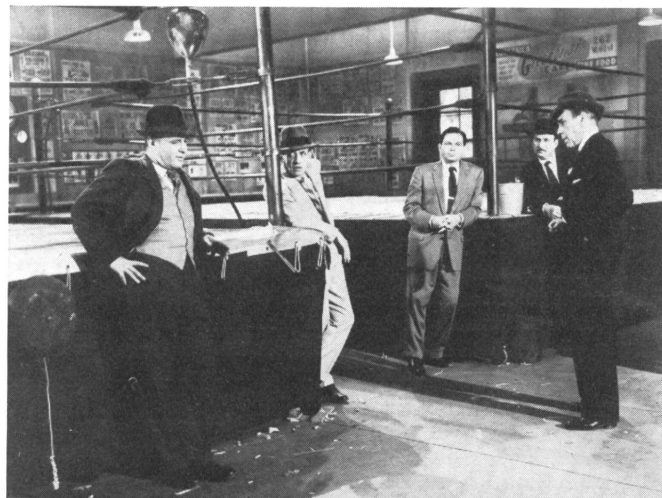
Humphrey Bogart als Journalist, der die Korruption im amerikanischen Boxsport nach langem Zusehen aufdeckt, in dem harten, gesellschaftskritischen Film «Schmutziger Lorbeer».

Die Geschichte liest sich, so zusammengefaßt, immer wie Kolportage. Sie ist es aber nicht; denn das Leben hat sie, wie man so sagt, geschrieben: sie beruht auf tatsächlichen Vorkommnissen (wie ja auch «On the Waterfront» auf tatsächlichen Vorkommnissen beruhte), und