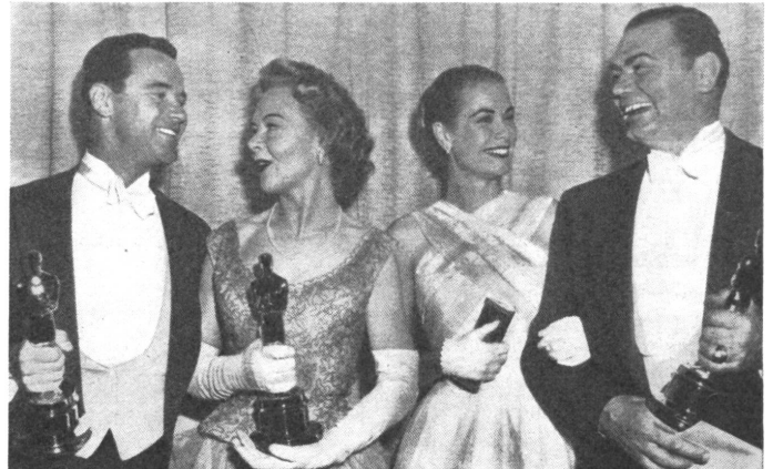
Oscars 1956 (von rechts nach links): Borgnine («Marty»), Grace Kelly, welche die Verteilung vornahm, Jo van Fleet («East of Eden»), Jack Lemmon («Mister Roberts»).