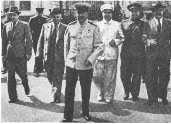
Stalin, dem 20 Jahre wildeste Despotie und Mord von Chrustschew und Genossen vorgeworfen werden, 1945 mit seinen engsten Mitarbeitern (von links nach rechts): Mikojan, Chrustschew, Malenkow, Beria und Molotow.