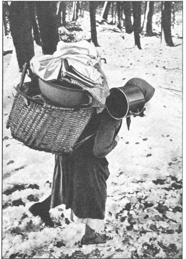
Auf der Flucht — heute in Europa, Advent 1956